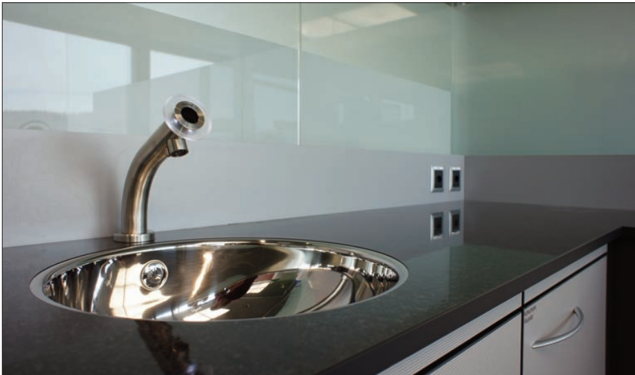
Miscea: Wasser, Seife und Desinfektionsmittel edel verpackt.