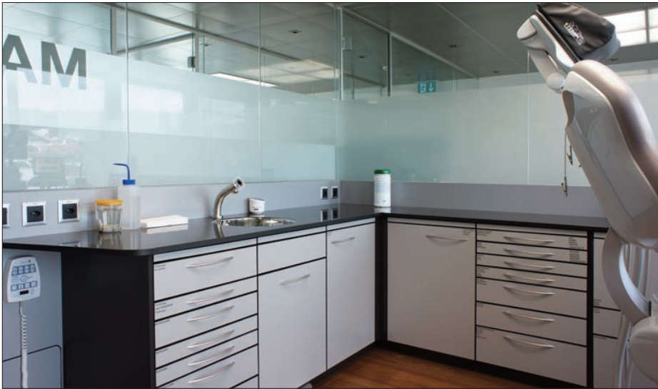
OP-Möbel: höchste Funktionalität in durchdachtem Design.