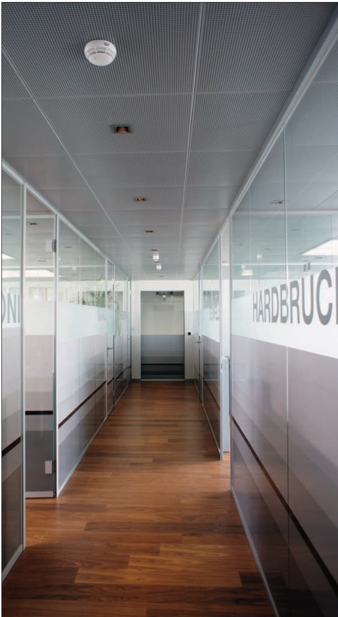
Ein harmonischer Mix trotz Gegensätzen: Holz, Glas und Metall.