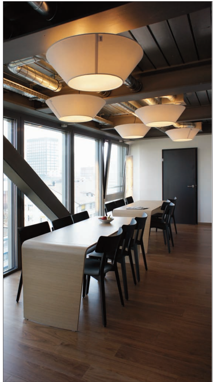
Aufenthaltsraum: sichtbare Installationen kombiniert mit wohnlicher Stimmung. Raumgestaltung durch: amb-raumgestaltung.ch

fanden im neuen Praxisteil ihren Platz. Ein grosszügiges Umkleidezimmer mit persönlichen Garderobenschränken sowie die hochwertig gestaltete Toilettenanlage runden den schönen Personalbereich ab.